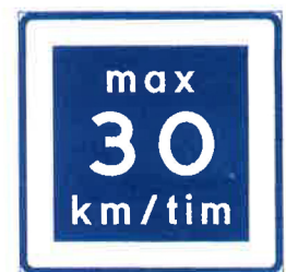
Rekommenderad lägre hastighet E11