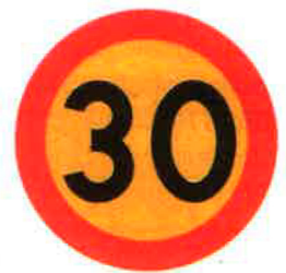
Hastighetsbegränsning C31, Max 30

Enskilda väghållare har dock ingen rätt att begränsa den lagligt gällande hastigheten på det egna vägnätet. Om föreningen önskar en lägre högsta tillåten hastighet än den generella bashastigheten, som är 50 km/tim i tätort och 70 km/tim på landsbygd, så måste föreningen anhålla om detta hos ansvarig myndighet. Ligger vägen i tätort ska den skickas för prövning till länsstyrelsen. Det är lämpligt (enligt somliga nödvändigt) att föreningens anhållan om hastighetsbegränsning diskuterats och beslutats på en stämma. Eftersom det är vanligare att anhållan avslås än